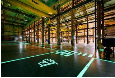
Innovation Dock

Uit de transformatie van het RDM-terrein blijkt dat je als ontwerper bij herbestemmingopgaven ook een goede onderhandelaar moet zijn en strategisch moet kunnen opereren.