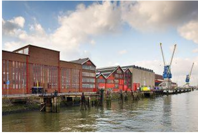
Exterieur van de Machinehal op het RDM-terrein.

De herbestemmingopgave biedt veel kansen, maar is niet eenvoudig. Architecten moeten zich staande houden in een enorm krachtenveld, waar allerlei tegengestelde belangen op elkaar afgestemd dienen te worden. Voor het meinummer van de Architect interieur onderzocht Marit Overbeek het transformatieproces van het Rotterdamse RDM-terrein.