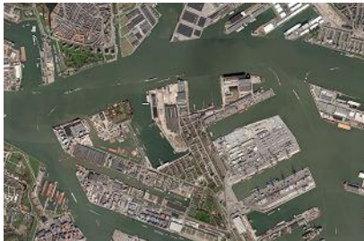
Luchtfoto van de Rotterdamse Stadshavens.